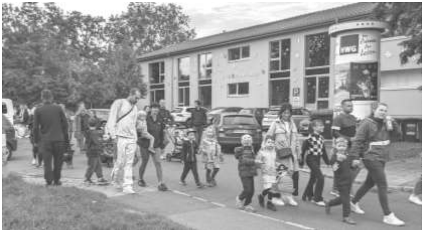
Umzug durchs Viertel