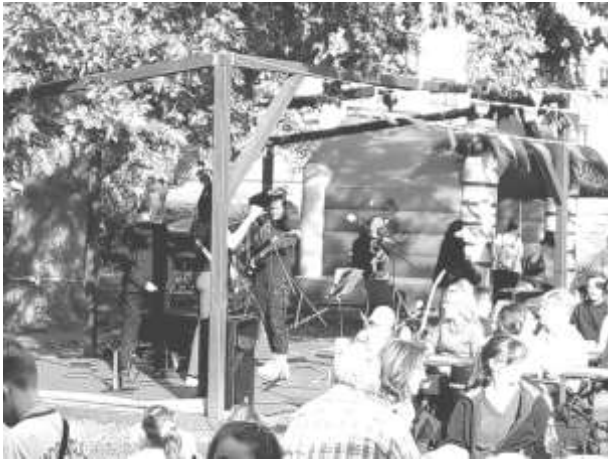
Die Mädchenband JSJ