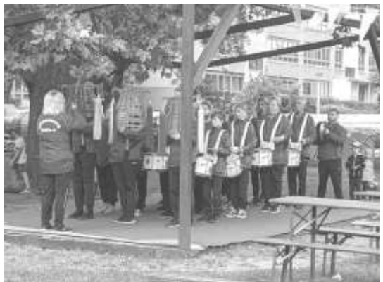
Der Spielmannszug eröffnet den Umzug