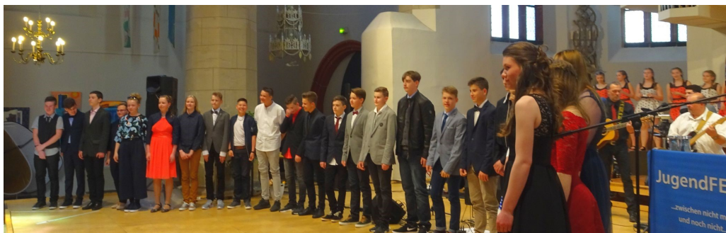
Die Teilnehmer*innen der ersten Feierstunde nach dem Eintrag ins Goldene Buch der JugendFEIER