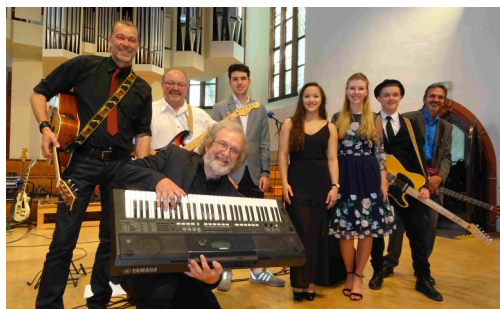
BORN (Band ohne richtigen Namen)