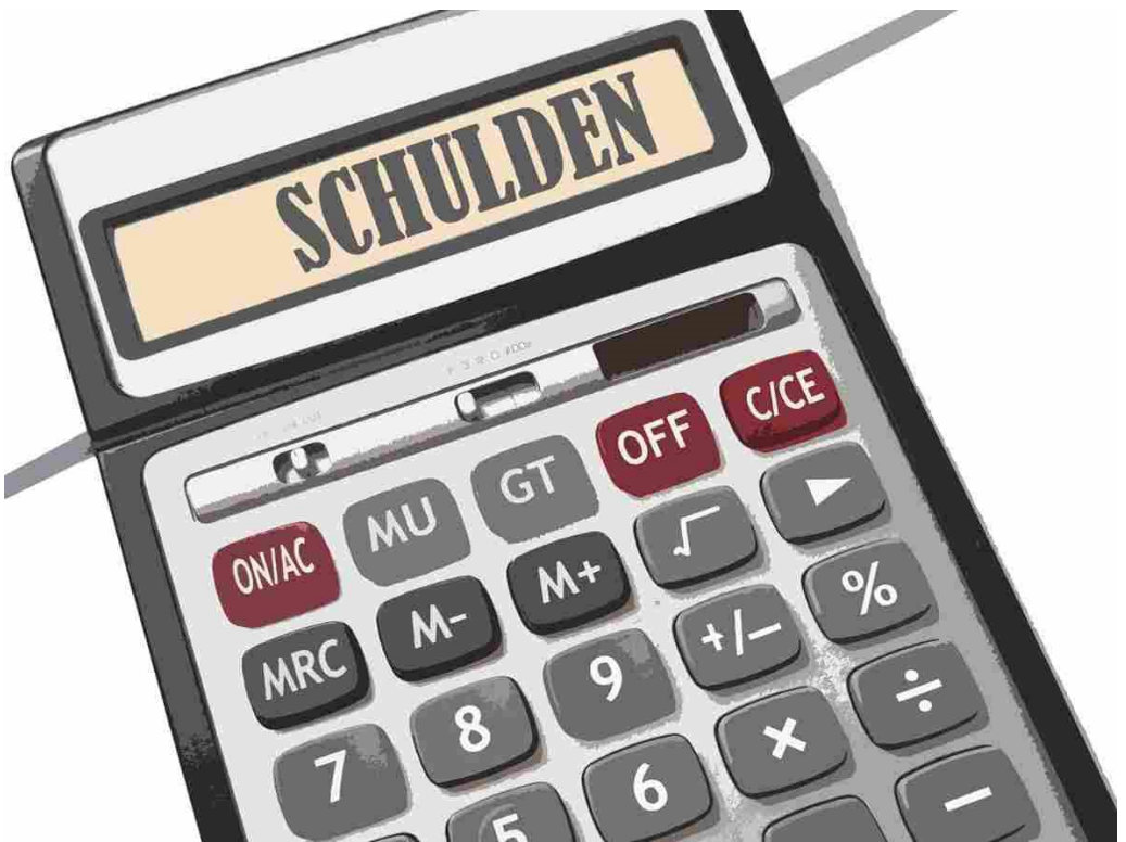
Grafik: S. Richter

sich lange Zeit schwergetan hat, Unterstützung zu suchen. Nach dem ersten Beratungsgespräch vergingen weitere sechs Jahre, bevor die Einsicht reifte, ein Verbraucherinsolvenzverfahren zu durchlaufen. Die vielen Schulden waren so drückend, dass sie mit dem niedrigen Gehalt der Familie nicht zu bewältigen waren. Inzwischen ist die Familie schuldenfrei und glücklich, diesen Weg gegangen zu sein. Jeder übrige Cent, der verdient wird, kann nun wieder in das Familiensparschwein wandern. Und wenn alles gut geht, ist 2019 der erste Urlaub seit über 12 Jahren möglich.