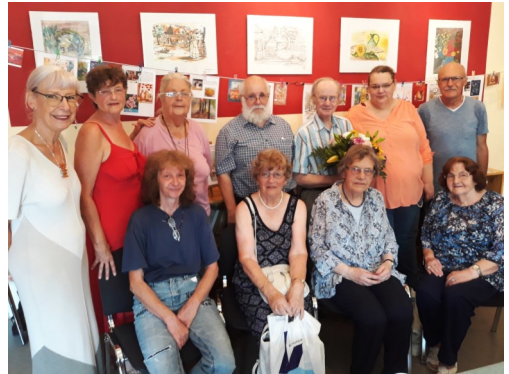
Einige aktuelle und ehemalige Mitglieder des Zirkels

Die weit über 100 Kunstwerke unterschiedlichster Motive, verwendeter Materialien und Stile, konnten bis 31. August 2018 im Rathshofs besichtigt werden.