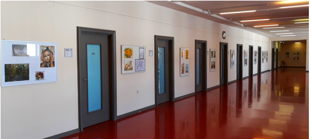
Weit über 100 Kunstwerke waren bis Ende August im Ratshof zu sehen.

Das Allerwichtigste jedoch, und dies bestätigen alle Zirkelfreunde, ist die Gemeinschaft.